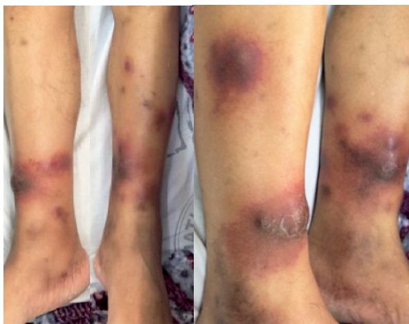
Figura 1. A) Lesiones nodulares eritematosas y violáceas bilaterales en miembros inferiores. B) Absceso de 4 cm de diámetro en miembro inferior derecho.

Presión arterial, 130/80 mmHg; frecuencia cardíaca, 81/min; frecuencia respiratoria, 19/min; temperatura 36,5 °C. En miembros inferiores se evidenció lesiones nodulares eritematosas y violáceas, dolorosas a la palpación, de 0,5 cm a 3,0 cm de diámetro, localizadas en cara anterior de ambas piernas (Figura 1A) y una