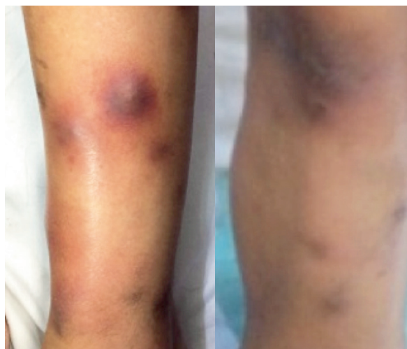
Figura 3. Miembro inferior izquierdo con lesiones nodulares de aspecto violáceo, diez días después del ingreso.

Tres días después: amilasa 2 453 U/L y lipasa 3 866 U/L. Cultivo de secreción de absceso del miembro inferior derecho y hemocultivo: Staphylococcus aureus , sensible a vancomicina.